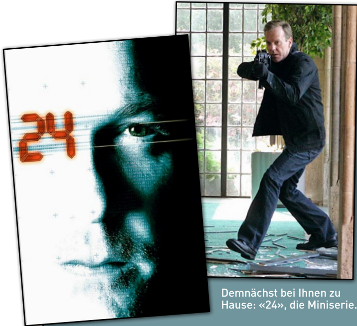
Demnächst bei Ihnen zu Hause: «24», die Miniserie.